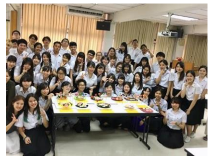
料理によるタンデム授業