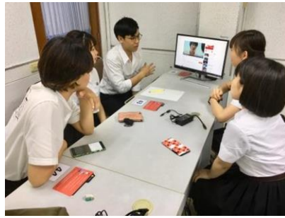
日タイ TVCM 比較