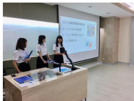
日本人学生はタイ語で、タイ人学生は日本語で、それぞれの「故郷(日 or タイ)のトピックを発表 (プレゼン準備は双方でサポート)